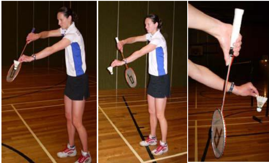
مراحل أداء مهارة الإرسال القصير